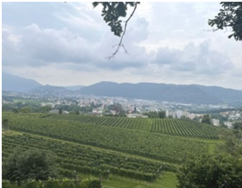
Abb. 1: Blick über die Reben hinweg auf Chiasso.

Drei Tage mit einem dichten und abwechslungsreichen Programm voller Kultur, Architektur, Geschichte, Kulinarik und Austausch. Wir besuchten das von Mario Botta umgebaute Fossilienmuseum, wo die aussergewöhnlichen Funde vom Monte San Giorgio (Unesco-Weltkulturerbe) ausgestellt werden.