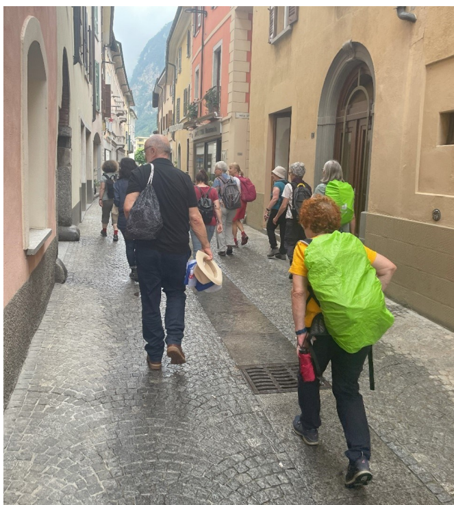
Abb. 4: Besichtigung des malerischen Städtchens Mendrisio.

Unser Ausgangsort Chiasso überraschte mit seinem wilden Architekturmix und seiner grossen Vergangenheit als Bankenstadt. Und doch ist die Natur nicht weit. Eine kurze Wanderung führte uns durch das nahe Naturschutzgebiet und in eine ganz andere Welt. Wir erhielten interessante Einblicke in die Geologie der Gegend und stiessen auf die Überreste eines Holcim-Werks, heute ein Industriedenkmal. Zum Abschluss genossen wir in einer ehemaligen Mühle am Flüsschen Breggia ein wunderbares Erdbeer-Risotto. Wir waren uns einig: Das Mendrisiotto hat uns alle überrascht und es gibt noch so viel zu entdecken. Wir kommen wieder!