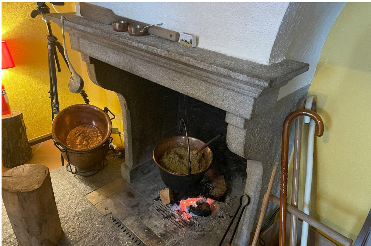
Abb. 3: Polenta auf offenem Feuer.

Nach der Besichtigung des hübschen Städtchens Mendrisio stiegen wir durch die Weinberge hoch. Auf dem Hof von Davide Cadenazzi genossen wir eine wunderbare Weingustation und wurden mit auserlesenen regionalen Spezialitäten aller Art verköstigt. Unglaublich fein! In Ceresio blieb Zeit für ein erfrischendes Bad im See, bevor wir uns für das Abendessen in ein typisches «Crotto» begaben, wo wir sahen, wie die Polenta auf dem offenen Feuer gekocht wird.