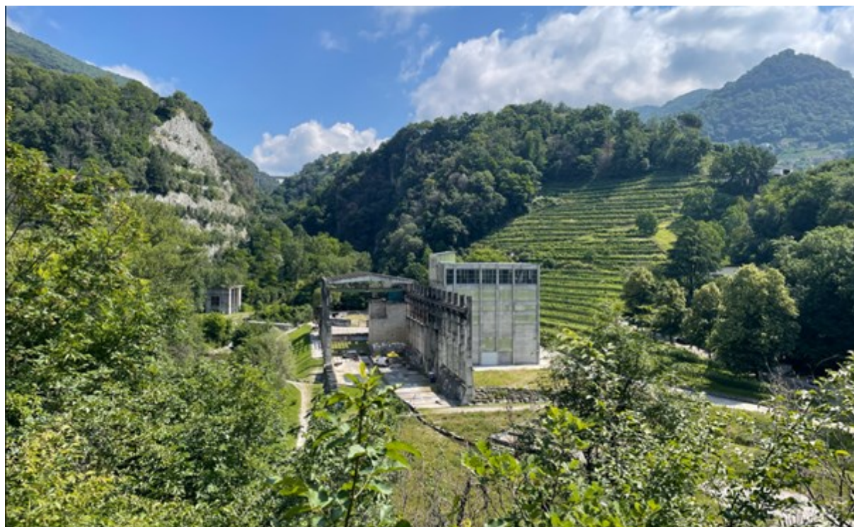
Abb. 2: Das ehemalige Betonwerk, heute ein Industriedenkmal mitten im Naturschutzgebiet.

Unsere Reiseleiterin berichtete uns umfassend über die Geschichte und Kultur der Gegend und wies uns immer wieder auf Besonderheiten hin. .